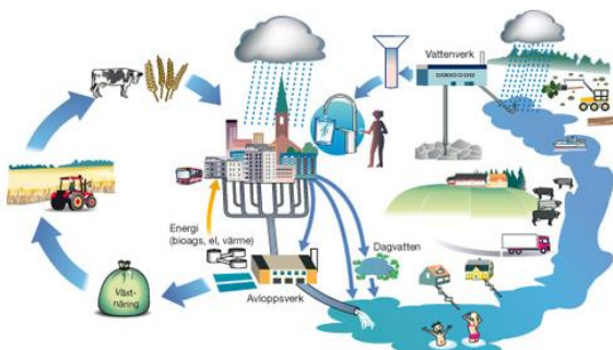
Figur 1.

Ett reningsverk är inte byggt för att rena vad som helst. Många ämnen påverkar reningsverkets processer och leder till att vattnet inte renas som det ska. Som verksamhetsutövare och användare av kommunens avloppsnät har du ett ansvar. Ditt ansvar är att veta vad ditt avlopps-vatten innehåller och att inte släppa ut ämnen i avloppet som inte reningsverket kan ta hand om.