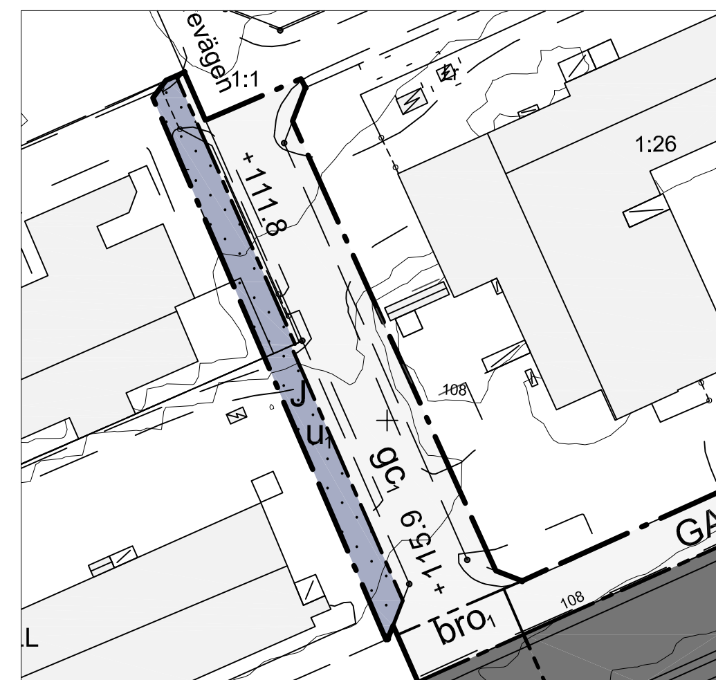
DELFÖRSTORING - Brorampens utrymmesbehov Skala 1:1000