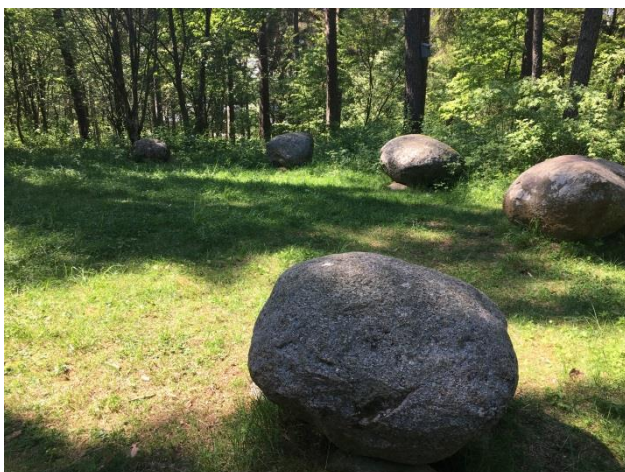
Kungshögarna i Mjölby. Ett gravfält från järnåldern.

Kyrkoguidningar i kyrkor som inte guidats så ofta, Skänninge marknads historia, Lunds backe och Öjebro har lockat flest besökare. (2016 30st. 2017 51st.)