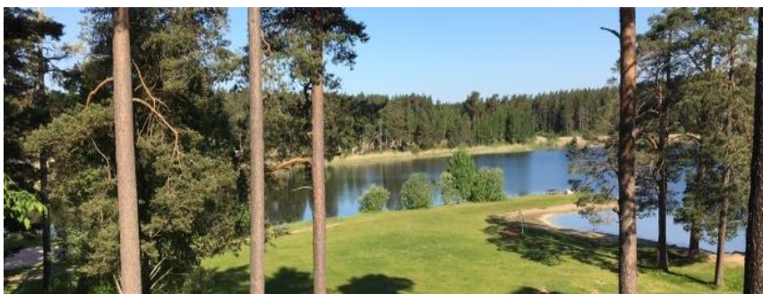
Skogssjön i Mjölby.

Skogssjön nyinvides i maj med flera aktiviteter, bland annat tipspromenad och musikunderhållning. (2017).