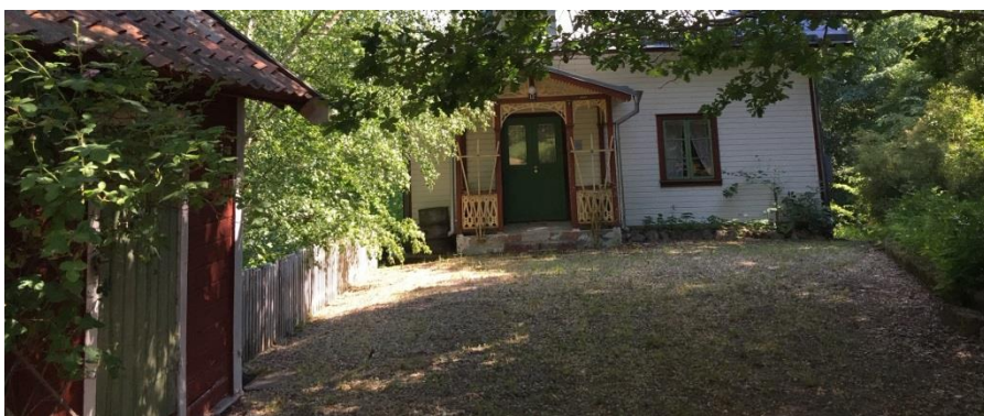
Skånska Lasses hus i Mjölby.

Östergötlands museum gjorde på uppdrag av kommunen en byggnadsdokumentation av Skånska Lasses Hus. Resultatet är en detaljerad information på hela 37 sidor. (2016). Huset används som museum och visas på beställning för grupper och besöktes under juli av en större grupp ättlingar till Skånska Lasse från Amerika. (2016).