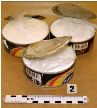
Cirka 2,5 kilo metamfetamin som Tullverket tog i beslag i Göteborg. Metamfetaminet låg förpackat i 15 förseglade konservburkar.

Psyket påverkas och aggressivitet, förvirring, förföljelsetankar, paranoia och depressioner är vanligt hos den som missbrukar centralstimulerande medel.