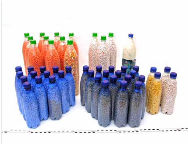
PET-flaskor med 180 236 ecstasytabletter som Tullverket tog i beslag i Trelleborg. Flaskorna låg gömda i bensintankarna på två personbilar.

Hallucinogener påverkar kroppen på komplicerade sätt som är svåra att förutsäga. Överansträngning, värmeslag, medvetlöshet, njur- och leverskador är vanligt. Akuta och kroniska psykiska skador förekommer liksom olika fysiska skador som följd av olycksfall under rus.