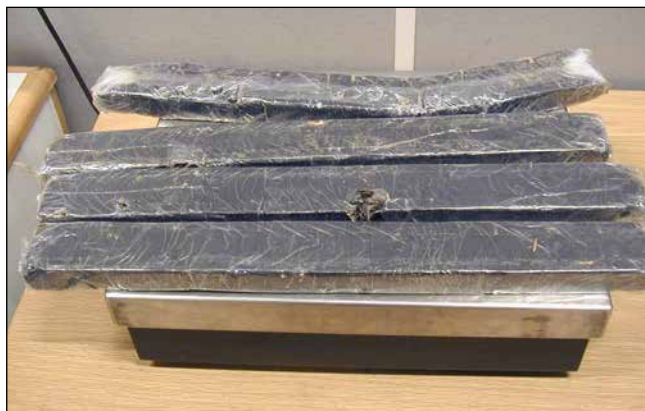
Bilden visar 18,2 kilo opium som Tullverket tog i beslag vid Öresundsbron. Narkotikan låg väl dold i fyra schackbord.

Opiater försämrar immunförsvaret vilket ökar risken för infektionssjukdomar. Dessutom kan andningen förlamas vilket kan leda till döden.