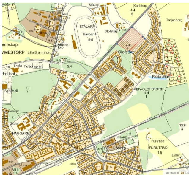
Orienteringskarta med tänkt planområde enligt kommunstyrelsens beställning ungefärligt avgränsat med rött rutnät.

Det tänkta planområdet omfattas av en gällande detaljplan som vann laga kraft 2007. Planens genomförandetid gick ut i juli 2017.