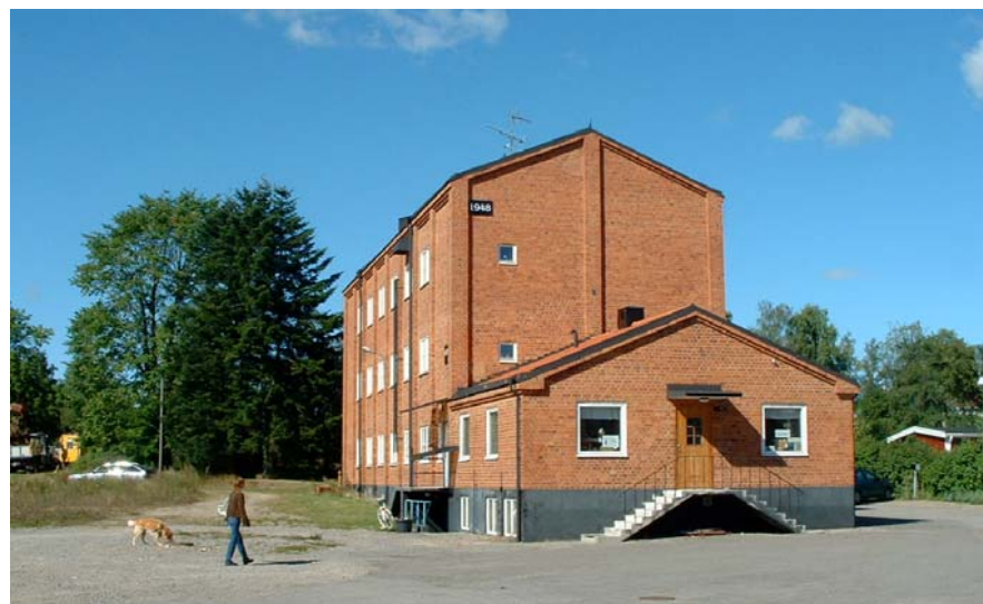
Kvarnbyggnad 1948 vid Magasinsgatan Numera bostäder för i huvudsak ungdomar

Med lokalt perspektiv vore det positivt att komplettera med bebyggelse som saknas idag: seniorboenden, arbetsplatsområden och verksamheter för kontorsändamål. Ungdomslägenheter behövs, men är svåra att ordna till bra pris. Läget är också bra för livsmedelsindustri och transportberoende verksamheter.