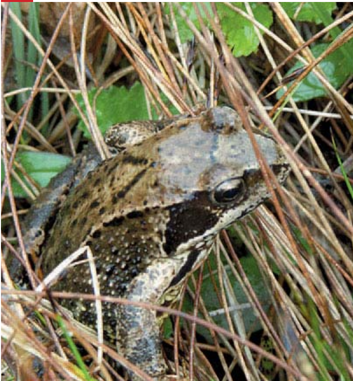
Alla groddjur och kräldjur är fridlysta i Sverige.