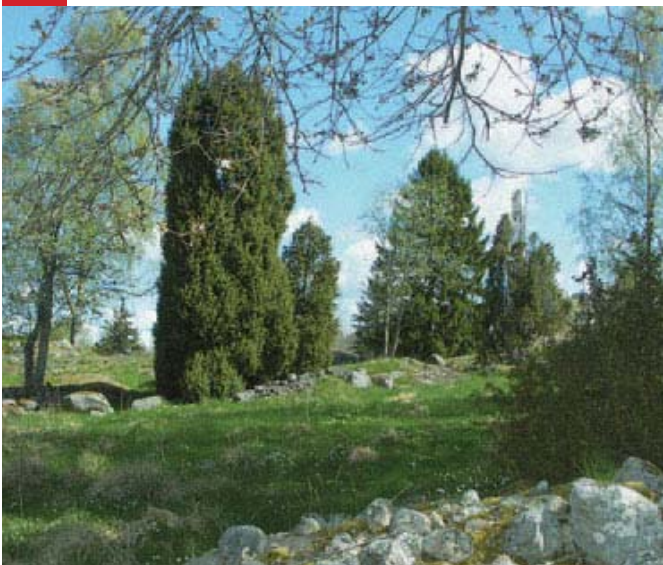
Hagarna vid Ramshult (sydöst om Önnebo) är Natura 2000-område