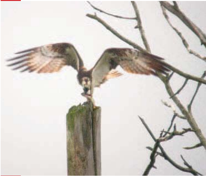
Fiskgjusen är en hotad art i Europa och är med i Natura 2000.

Det vanligaste sättet att skydda värdefull natur är att bilda naturreservat. Ett reservat bildas av Länsstyrelsen eller kommunen, som också har ansvar för att det sköts om. Naturreservat har starkt skydd och varje reservat har en egen skötselplan som anpassas efter områdets värden och behov. Skötselplanen görs om efter ca tio år. I Mjölby kommun finns sex naturreservat: Skogssjöområdet, Solberga, Stämman, Tåkern, Åsabackarna och Örbacken.