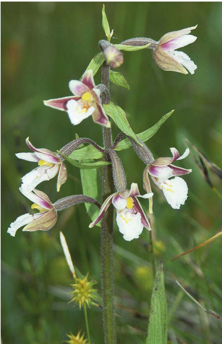
Kärknipprot i Örbackens naturreservat. Alla vilda orkidéer är fridlysta i Sverige.