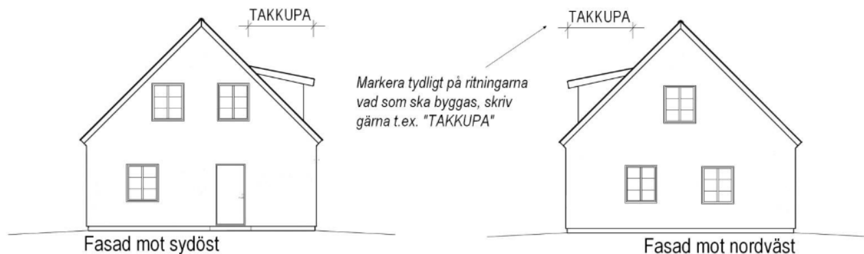
Fasad mot sydöst