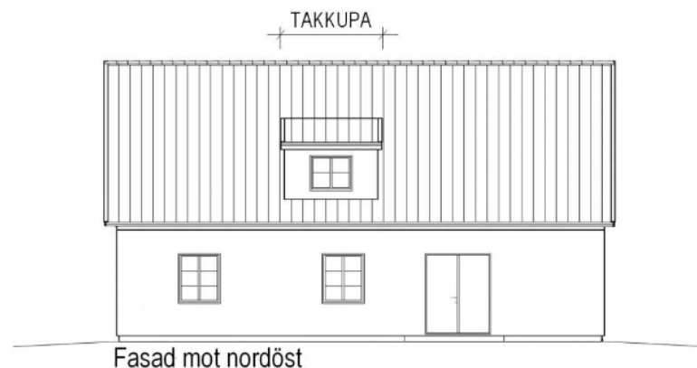
Fasad mot nordöst

Markera tydligt på ritningarna vad som ska byggas, skriv gärna t.ex. "TAKKUPA"